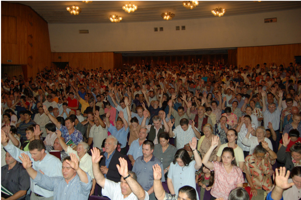
Valokuva kokouksesta Romaniassa elokuussa 2006. Tässä julkaisussa me voimme tuoda esille vain muutamia monista valokuvista kaikkialta maailmaa. Sato on suuri.