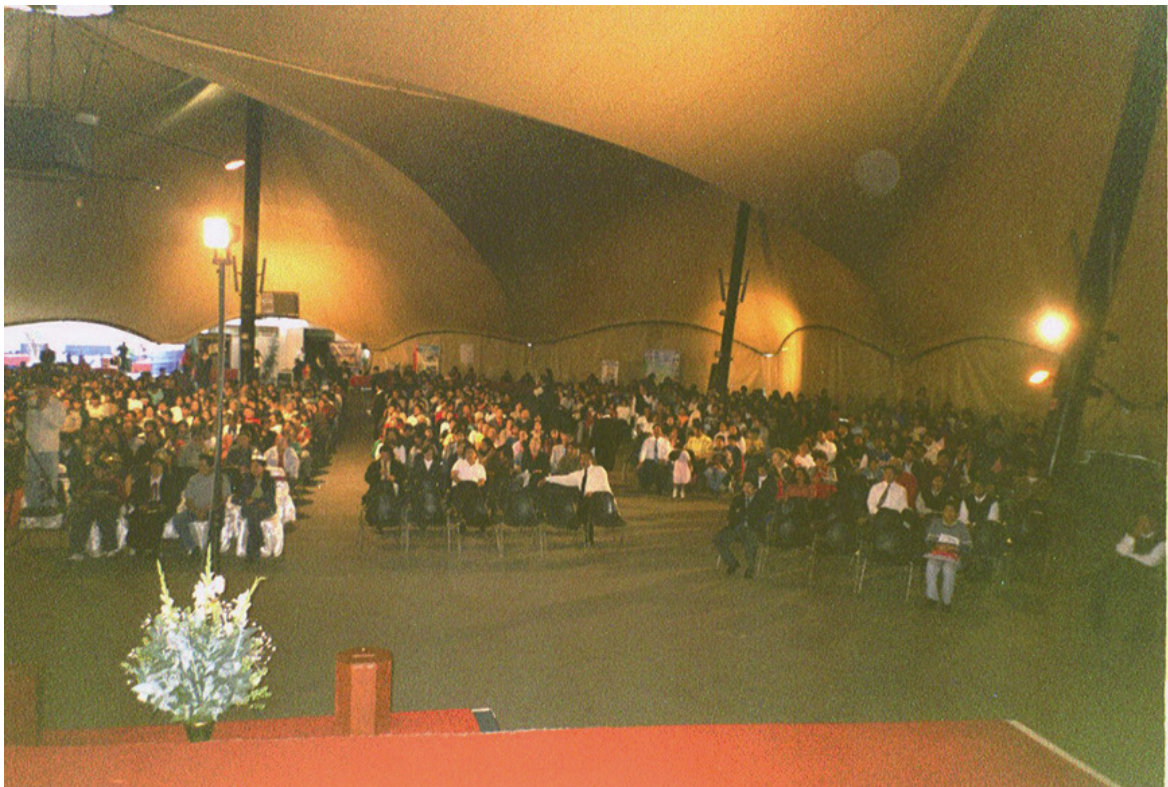
Kuva eräästä kokouksesta Limassa Perussa, lokakuussa 2005.