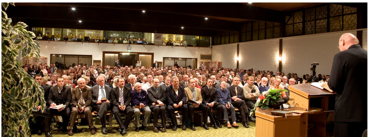
Valokuva kokouksesta ensimmäisenä viikonloppuna syyskuussa 2006, johon veljet ja sisaret koko Euroopasta ovat osallistuneet, kuullakseen Jumalan Sanan. Hengellinen nälkä on tunnettavissa, hengellinen ruoka on valmis.